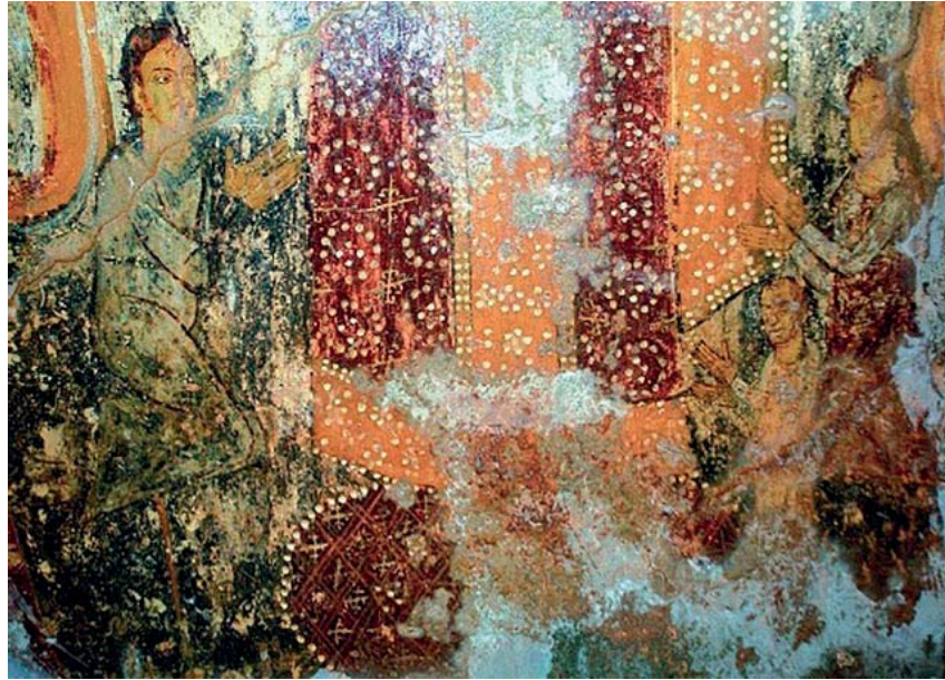
Εικόνα 3: Κτητορικό πορτρέτο. Ναός του Αγίου Νικολάου, Έξω Νύφι, Κάτω Μάνη, 1284/1285 (Αγρέβη, «Άγιος Νικόλαος», πιν. VII.2).