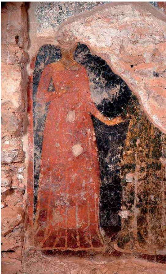
Εικόνα 9: Αφιερώτριες. Ναός της Παναγίας Οδηγήτριας (Αφεντικό), Μονή Βροντοχίου, Μυστράς, 14ος αι. (Kalamara, «Clothing», εικ. 104).