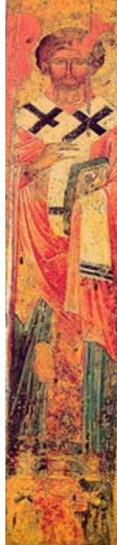
Εικόνα 10: Φορητή εικόνα του Αγίου Ελευθερίου. Ναός της Παναγίας Χρυσалиνιώτισσας, Κύπρος, μέσα 14ου αι. (Παπαδάμου, «Διαπολιτισμική», εικ. 112β).