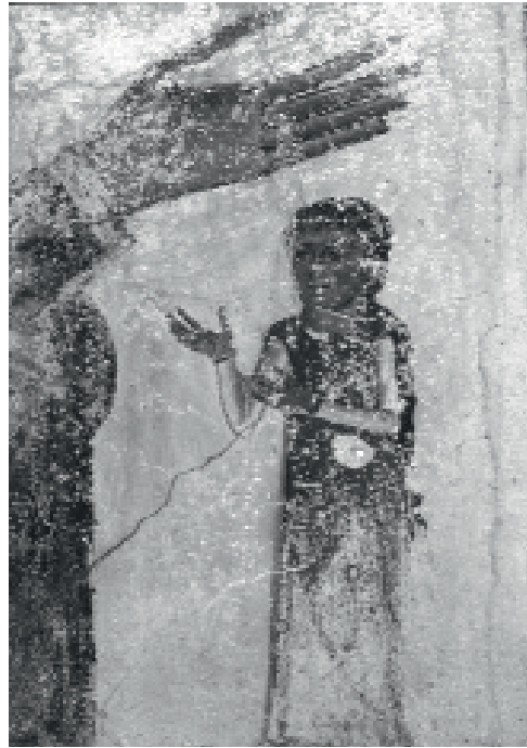
Εικόνα 6: Η δωρήτρια. Ναός της Αγίας Κυριακής, Μάραθο, Μέσα Μάνη, π. 1300 (Kalopissi-Verti, «Patronage», εικ. 52).