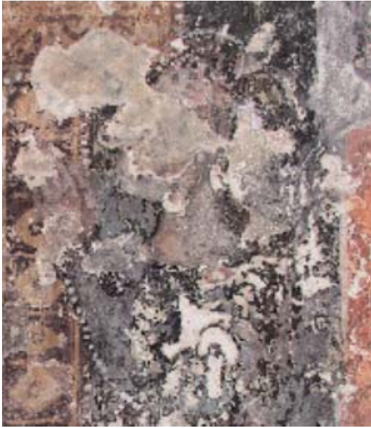
Εικόνα 8: Δωρήτρια. Ναός της Αγίας Μαρίας, Muro Leccese, Ιταλία, 13ος αι. (:) (Safraan, «Scoperte salentine», εικ. 17).