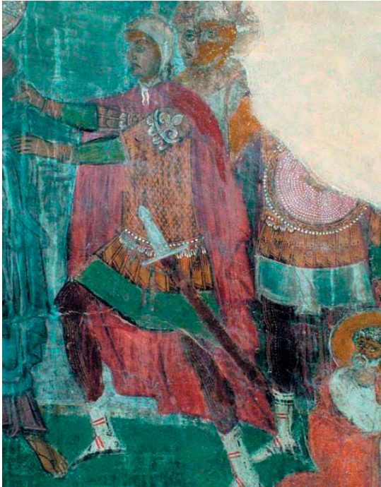
Εικόνα 5: Γασμούλοι στρατιώτες. Τοιχογραφία της Προδοσίας. Ναός της Παναγίας Χρυσαφίτισσας, Χρύσαφα, Λακωνία, π. 1290 (D'Amato, «Betrayal», εικ. 40).