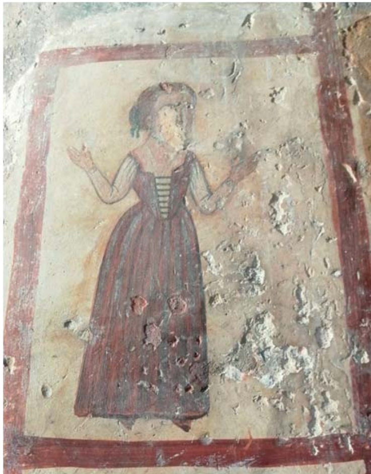
Εικόνα 4: Η Ρέλλα (Ρέλια) Μεγαλοκονομοπούλα. Ναός του Αγίου Ανδρέα, Λιβάδι, Κύθηρα, π. 1628.